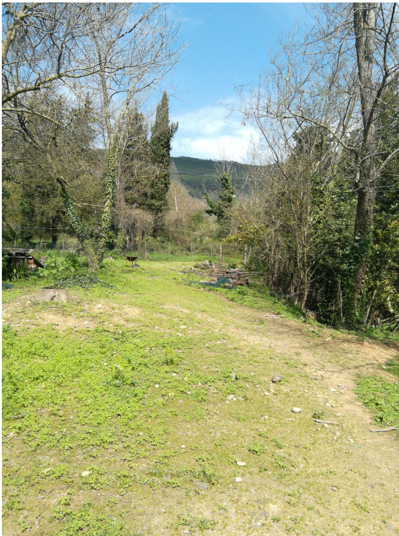
ALLEGATO 5 - LATO RIO GRIFONE