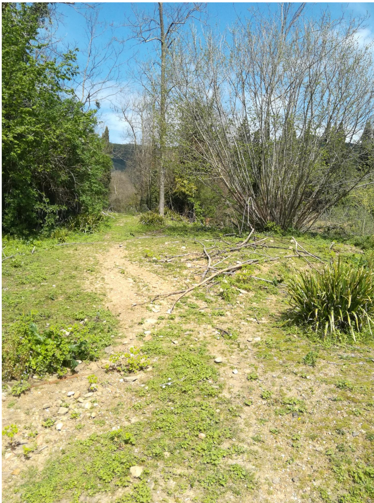
ALLEGATO 6 - LATO EST